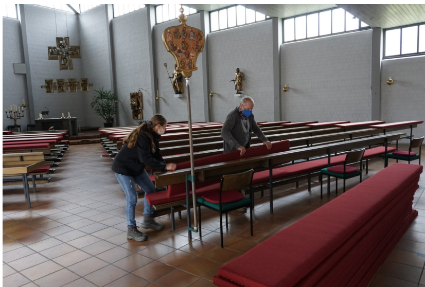
Foto: Vom Polsterbetrieb Pfitzmaier aus Oberstreu wurden die neuen Sitzkissen für die Kirche gefertigt und auf den Holzbänken angebracht.

Deshalb hat die Kirchenverwaltung jetzt eine Neuanschaffung beschlossen und in Auftrag gegeben. Nachdem in der Kirche der graue Farbton dominiert, wurde für die Sitzkissen eine weinrote Struktur gewählt. „Der Anschaffungspreis belastet die diesjährige Kirchenbilanz schon nicht unerheblich“, so Kirchenpfleger Artur Schmitt. Zumal die coronabedingten Gottesdienstbeschränkungen sich auch beim Klingelbeutelgeld bemerkbar gemacht haben. Vor diesem Hintergrund hofft der Kirchenpfleger auf entsprechende Akzeptanz des Kirchgelds bei den Gläubigen. Ein persönliches Schreiben wurde von der Kirchenverwaltung diesbezüglich verteilt. „Helfen Sie auch auf diesem Weg mit“, so Artur Schmitt in seinem Rundbrief, „dass Sankt Dionysius eine attraktive und lebendige Pfarrgemeinde mit einem schönen Haus für Gott und die Menschen bleibt!“. Und neben den Richtwerten für die Kirchgeldhöhe wird auch die Bankverbindung (IBAN: DE94 7906 9165 0002 1274 74), sowie der Termin für eine mögliche Barzahlung genannt. So kann am Sonntag, 6.12.2020 nach dem Gottesdienst das Geld im Nebenraum der Kirche abgegeben werden. Auch die Abgabe in einem Kuvert im sonntäglichen Klingelbeutel (Namensangabe nicht vergessen) ist möglich.