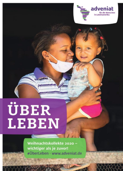
Adveniat-Weihnachtsaktion 2020: ÜberLeben auf dem Land