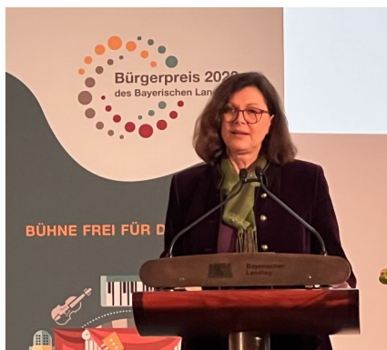
Landtagspräsidentin Ilse Aigner bei der Preisverleihung

Der Bürgerpreis steht für Solidarität, Zusammenhalt und Mitmenschlichkeit. Wir verleihen einen Preis für das Miteinander und das Füreinander, denn darin liegt die wahre Stärke unseres Landes!“ Landtagspräsidentin Ilse Aigner machte dies in ihrer Rede anlässlich der Preisverleihung des Bürgerpreises 2022 deutlich. Die Vereinsgemeinschaft hatte sich im Frühjahr um den mit 50.000 Euro dotierten Preis beworben, der in diesem Jahr unter dem Motto stand: „Bühne frei für das Leben! Ehrenamtliches Engagement für gesellschaftliches Miteinander durch Kunst und Kultur“. Ein Motto, das zur kulturellen Vielfalt in Wargolshausen passt. Das sah auch der Beirat so. Ein Gremium, dem neben der Landtagspräsidentin und verschiedenen Abgeordneten auch Prof. Dr. Bausback angehörte. Und der frühere Justizminister war ja bereits als Überraschungsgast bei Fredi Breunigs „Breezel, Bier und domms Gebabbel“ in Wargolshausen zu Gast und kannte somit einen kleinen Ausschnitt der kulturellen Aktivitä-