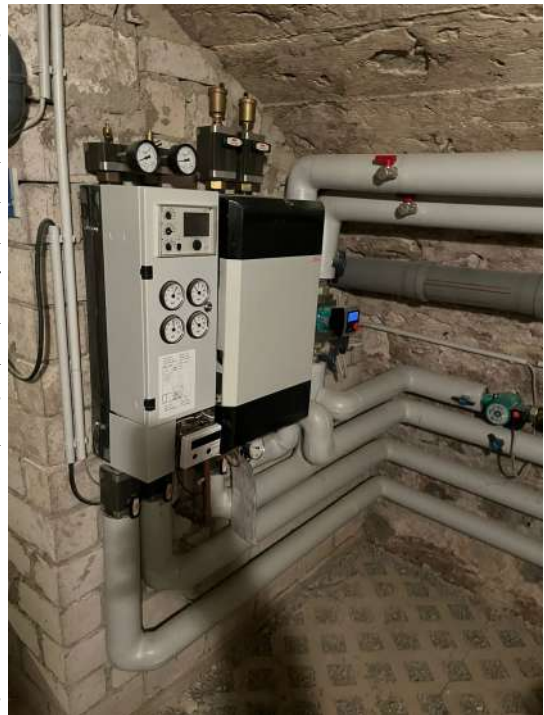
Foto oben: Übergabestation in einem Haushalt in Rieden bei Werneck

bekanntgegeben werden. Dazu sind alle, die bisher einen Erhebungsbogen abgegeben haben, aber auch alle, dem Nahwärmeprojekt offen gegenüber stehen, herzlich eingeladen.