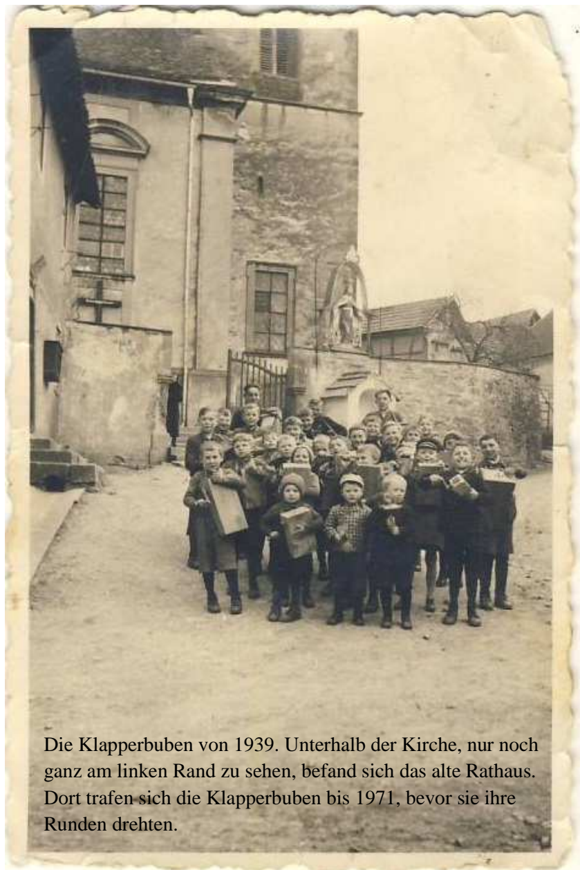
Die Klapperbuben von 1939. Unterhalb der Kirche, nur noch ganz am linken Rand zu sehen, befand sich das alte Rathaus. Dort trafen sich die Klapperbuben bis 1971, bevor sie ihre Runden drehten.

Irgendwie gehört das Angstmachen zum Klappern, wie das frühe Aufstehen und das Sammeln von Geld- und Sachspenden am Karsamstag dazu. Anekdoten dazu gibt es haufenweise. In diesem Jahr soll es sogar zu einer Entführung gekommen sein. Aber es war alles halb so schlimm. Bis zum Frühstück nach der ersten Klapperrunde am Karfreitagmorgen waren alle Klapperer in Freude vereint. Und so genoss man morgens kurz nach 5.00 Uhr den „Russischen Zupfkuchen“, den eine Klapperanführerin höchstpersönlich gebacken hatte; zu einer Tasse warmen Kakao selbstverständlich. Auch so eine Neuerung übrigens, die im Laufe der Jahre dazugekommen ist. Oder hängt das Klapperfrühstück vielleicht damit zusammen, dass neuerdings Mädchen beim Klappern dabei sind?