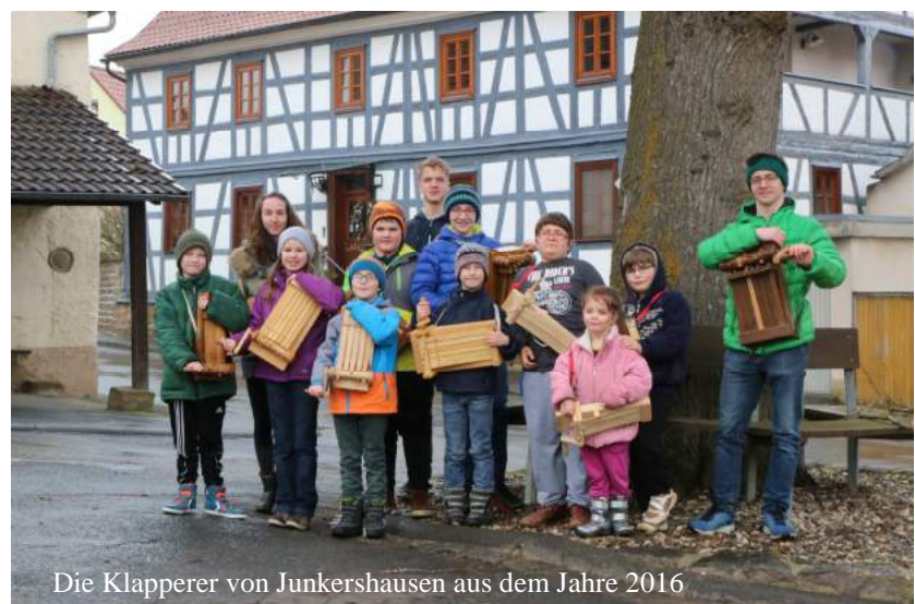
Die Klapperer von Junkershausen aus dem Jahre 2016