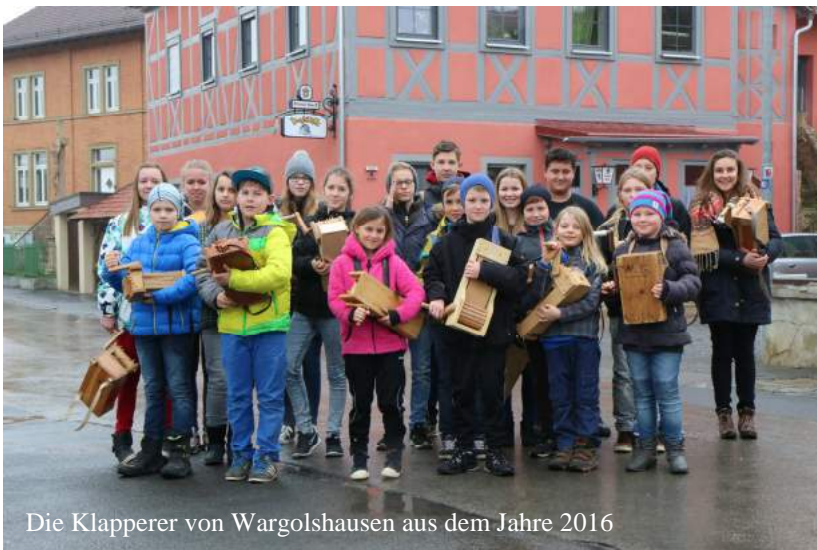
Die Klapperer von Wargolshausen aus dem Jahre 2016