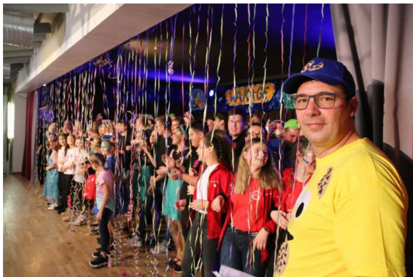
Foto: Ungetrübt Fasching feiern wie letztmals 2020. Das wünschen sich nicht nur die Verantwortlichen der Wa-Ka-Ge, sondern auch die Narren

Den Auftakt machte der Landesverband Franken im Bund Deutscher Karneval.: „Bei der Kultsitzung „Fastnacht in Franken“ im Februar 2022 wird die 2G-Reglung angewandt werden“. Soweit will die Wa-Ka-Ge nicht gehen. Aber in Absprache mit den regionalen Faschingsgesellschaften im Landkreis soll die Regelung 3G+ (geimpft, genesen, PCR-getestet) bei allen Faschingsveranstaltungen gelten. So ist zumindest der aktuelle Stand bei den derzeit geltenden gesetzlichen Vorgaben. Wie die Wa-Ka-Ge in einer Mitteilung an die Aktiven, Elferäte und Gardemädchen verdeutlicht hat, gilt diese Regelung ausnahmslos für alle. Lediglich für Schülerinnen und Schüler, die mittels Schülerschein die regelmäßige Testung in den Schulen nachweisen können, entfällt diese Pflicht. „Nur dadurch“, so die Meinung des Wa-Ka-Ge-Präsidiums, „besteht die Möglichkeit, ungetrübt Fasching zu feiern“. Denn bei 3G+ gilt: Keine Maskenpflicht, keine Abstandsregelungen erforderlich, Fasching feiern, wie vor Corona. Das setzt aber voraus, dass diese Regelung konsequent umgesetzt wird. Schließlich liegen die Bußgelder für den Veranstalter bei