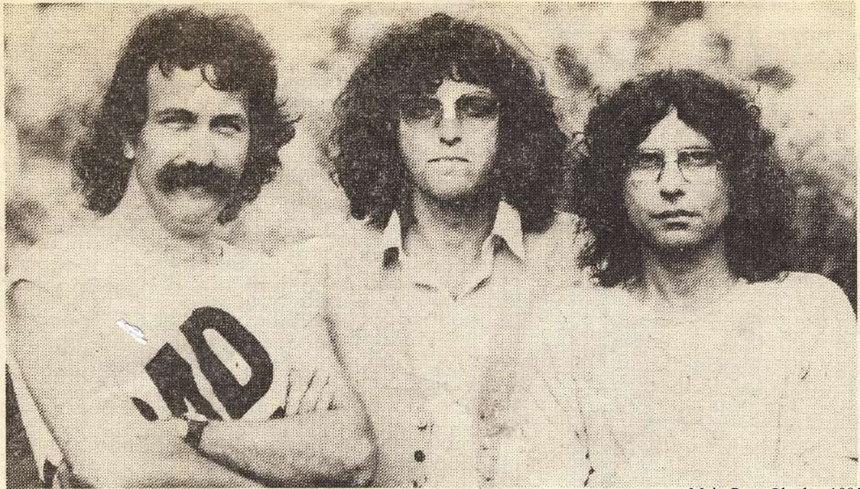
„Fürstenfeld“ machte die drei STSler berühmt. Jetzt gastieren sie in Wargolshausen.

gesetzte Konzert war in kürzester Zeit ausverkauft, so dass am Sonntag, 26.10. ein Folgekonzert angesetzt werden musste. Die Fans können sich freuen.